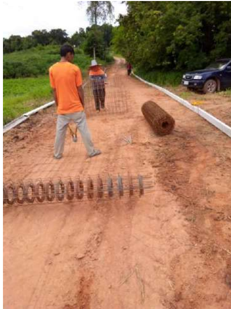
โครงการก่อสร้างถนนคอนกรีตเสริมเหล็กภายในหมู่บ้าน หมู่ ๑๑